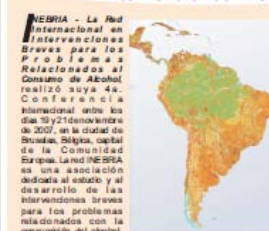
La Conferencia de la INEBRIA en Lisboa, Portugal. En el origen de la INEBRIA están los investigadores europeos implicados con el proyecto PHEPA ( pepha.net ).

La Conferencia de la INEBRIA En esta conferencia de INEBRIA en Bruselas algunos académicos importantes han sido discutidos, como por ejemplo, la efectividad de las intervenciones breves en la atención primaria (vase en este boletín más información al respecto), así como el trabajo de los IB en diversos