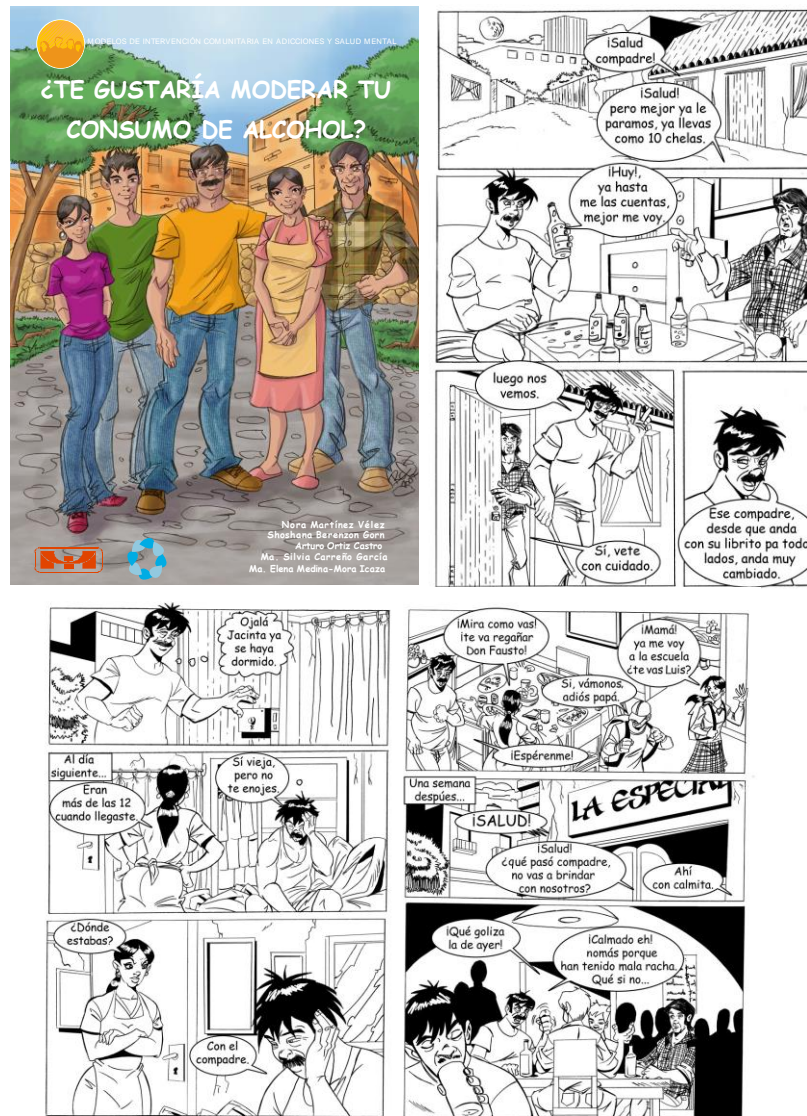
Figura 1. Historieta ¿te gustaría moderar tu consumo de alcohol?

papel del dueño de la fábrica. Se cambió la expresión de los rostros de los personajes (menos anguladas, más curvas y menos oscuras) y se diseñó una nueva portada. La versión modificada se sometió a corrección de estilo. El resultado es la historieta ¿Te gustaría moderar tu consumo de alcohol? 5 (figura 1)